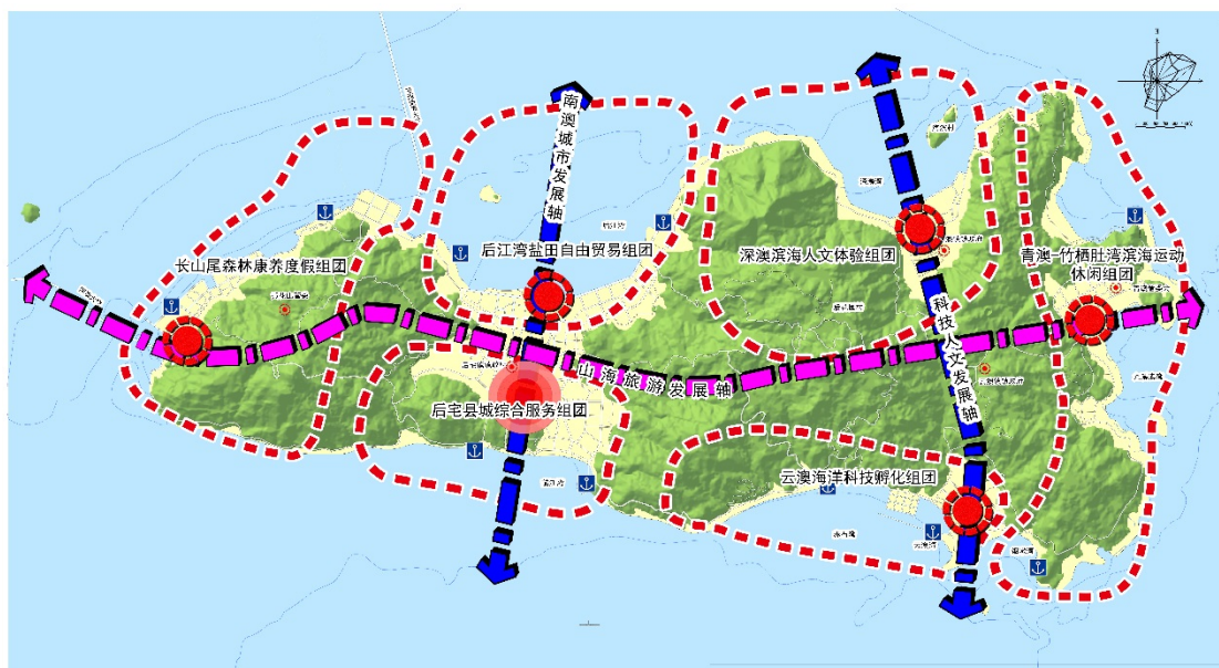
图 3-2 南澳县主岛特色功能布局图

——后宅县城综合服务组团。以现状后宅县城为核心，积极推进农渔业转移人口市民化，承担行政、居住、商贸、产业、金融、科教、信息等主要城市服务功能，同时为全岛提供酒店、商务、会展等旅游性综合服务。适度谋划海洋科技职业教育、国际滨海文化交流、旅游综合服务、体育竞赛表演服务、农业科技服务、农业对外开放合作等特色平台。