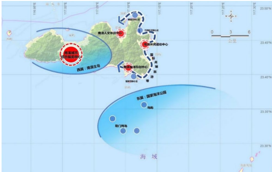
图 3-1 “一带两翼”的空间结构

——一带，国际高端旅游带。一带是范围为南澳北角山至烟墩湾码头沿岸长约26公里、沿山脊线至海岸线宽度在0.1-1.2公里之间的区域，总面积约为12平方公里，包括烟墩湾、青澳湾、竹栖肚湾、九溪澳湾等核心地段，作为高端旅游产业开发的集聚区、特区开放发展的前沿带以及南澳未来经济发展的新引擎。